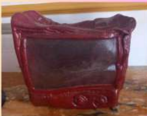
Sophie Kimberly Seguin Lalonde, Qui veut d'une vieille TV carrée qui n'a que des vieilles histoires à raconter? , 2011.

De plus en plus nombreux et envahissants, les objets manufacturés sont un symbole de la société de consommation. Les artistes portent un regard tantôt amer, tantôt amusé sur le devenir des objets et la relation que nous entretenons avec eux.