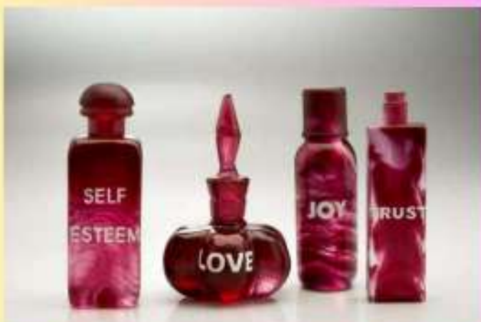
Silvia Levenson, Self Steem , 2018.

Que cela soit par le biais des réseaux sociaux ou de l'apparence physique, plaire est une question intrinsèque à la société. Au travers d'œuvres séduisantes, les artistes questionnent l'ambivalence de l'image que l'on donne à voir pour être bien vu.