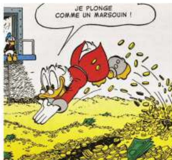
Balthazar PICSOU dans son coffre-fort géant à Donaldville. Personnage de fiction créé en 1947 par Carl BARKS (studios Disney) réputé pour son avarice.