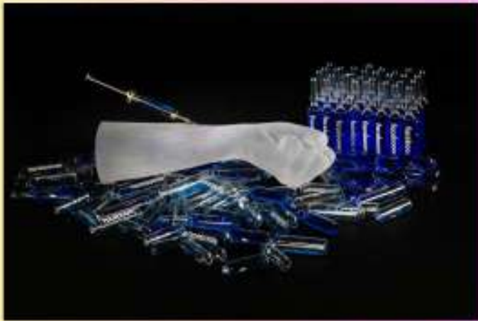
Krista Israel, Facing my addiction , 2016.