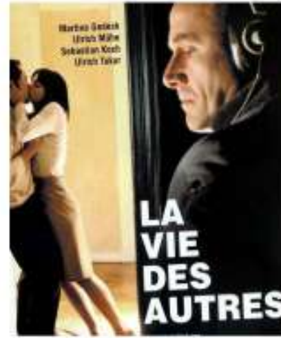
Florian HENCKEL VON DONNERSMARCK, La vie des autres , 2006.

Allemagne de l'Est, 1983. Ayant exprimé le doute qu'un dramaturge célèbre soit loyal envers la ligne communiste, Gerd Wiesler, un officier de la Stasi, reçoit l'approbation d'espionner l'homme et sa maîtresse, l'actrice Crista-Maria. Contre toute attente, Wiesler sympathise avec le couple et vit bientôt un conflit personnel lorsque son supérieur, qui s'intéresse à l'actrice, lui ordonne de faire disparaître le dramaturge.