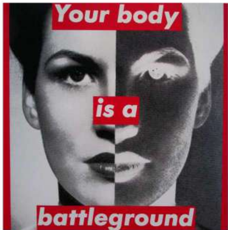
Barbara KRUGER, Your body is a battleground [ Ton corps est un champ de bataille ], 1989.

Entre injonctions et individualisme, comment vivre en société ?