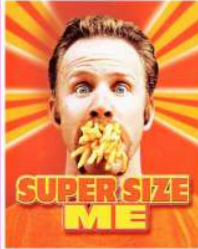
Morgan SPURLOCK, Super Size Me, ou Malbouffe à l'américaine , 2004.

L'opulence de nourriture est un signe de vie et de richesse. Mais si manger est nécessaire pour vivre, les sociétés occidentales, incarnées par les icônes américaines des fast-foods, inversent la logique jusqu'au dégoût et à la maladie.