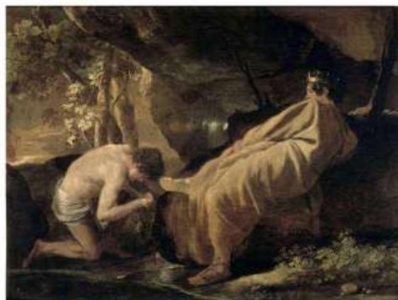
Nicolas POUSSIN, Midas à la source du Pactole , vers 1627.

Dans la mythologie grecque, le roi Midas obtient du dieu Dionysos le pouvoir de changer en or tout ce qu'il touche. Pris au piège de son propre souhait, Midas ne peut plus s'alimenter. Pour se purifier et se délivrer du châtement, Dionysos l'invite à se laver à la source du fleuve Pactole.