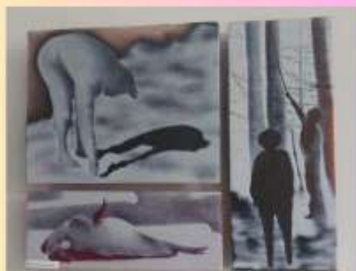
April Surgent, Desolation Sound, 2012.

Coupes rases, pollution, réchauffement climatique ... Le constat est déjà très lourd aujourd'hui. Malgré les prévisions scientifiques inquiétantes nées dans les années 1970 et le bon sens des préceptes humains, les catastrophes écologiques continuent à se multiplier partout sur la planète.