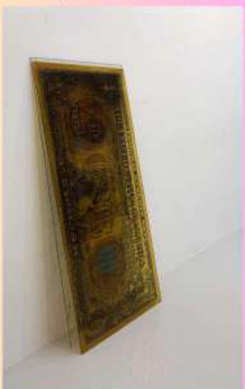
Yeun Kyung Kim ,1$, 2023.

La place prépondérante de l'argent dans nos sociétés contemporaines n'est plus à démontrer, aussi bien d'un point de vue marchand que symbolique. Au sein d'une sphère artistique liée en partie à la dimension marchande des œuvres, les artistes sont tour à tour fascinés par l'argent ou critiques à son égard.