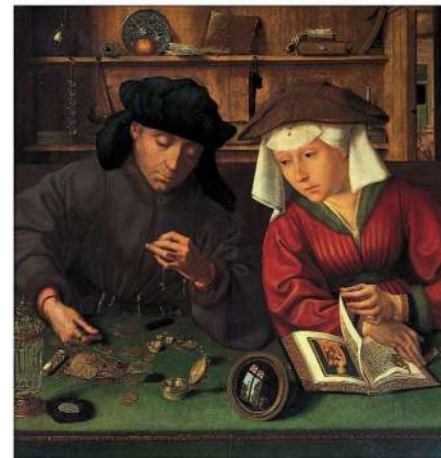
Quentin METSYS, Le Prêteur et sa femme , 1514.