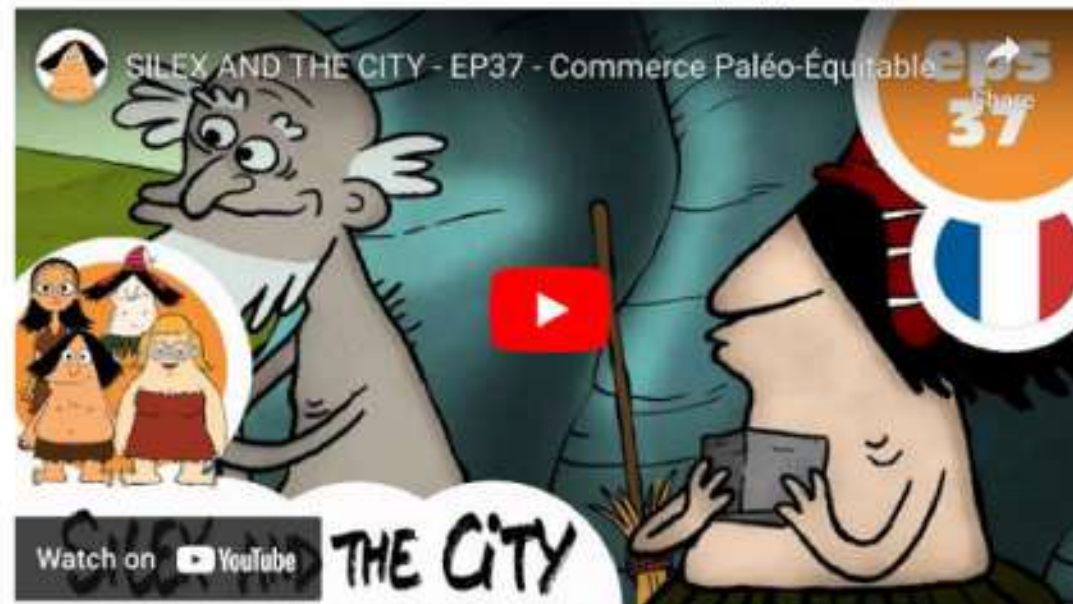
Silex and the city , épisode 37 "Commerce paléo-équitable".