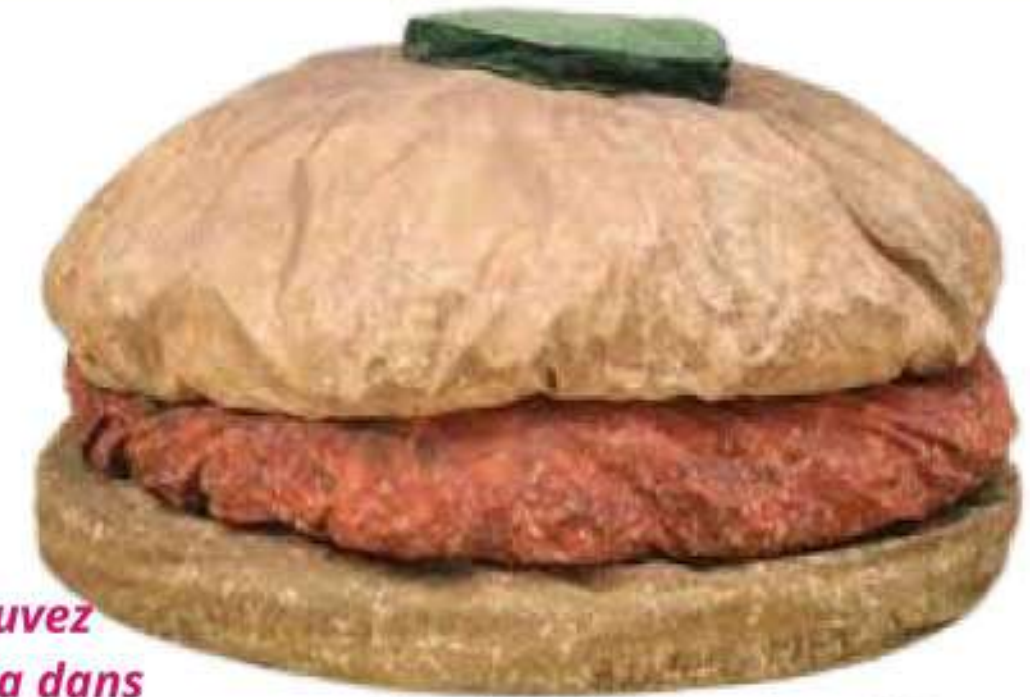
Claes OLDENBURG, Floor Burger , 1971

Comment les artistes font état d'un acte quotidien, et vital tel que se nourrir, et en influent notre perception?