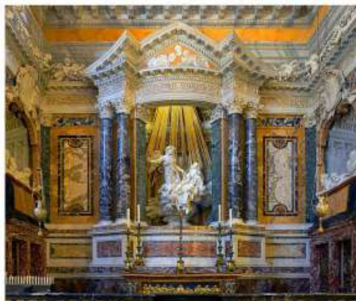
LE BERNIN, L'Extase de Sainte Thérèse , 1645-1652, marbre, installée dans la Chapelle Cornaro de Santa Maria della Vittoria de Rome.