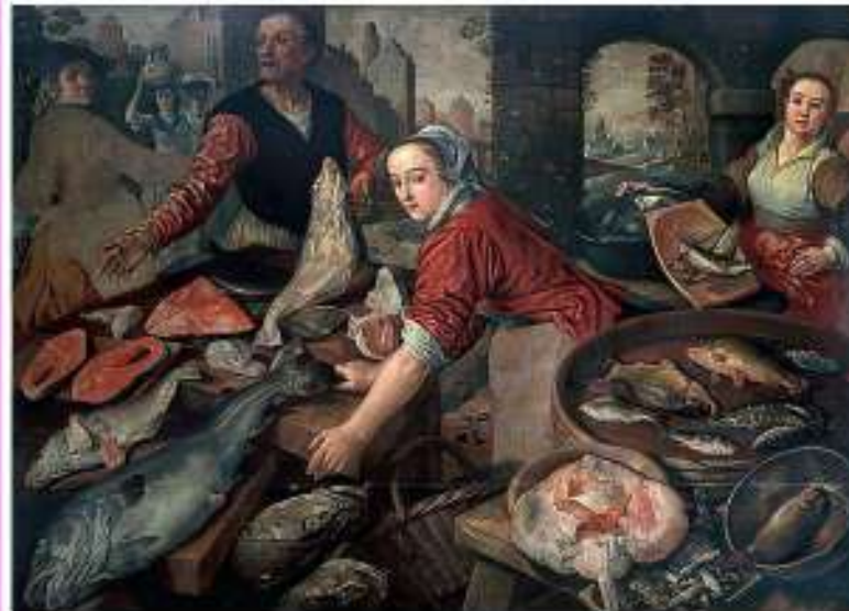
Joachim BEUCKELAER, Marché aux poissons , 1570