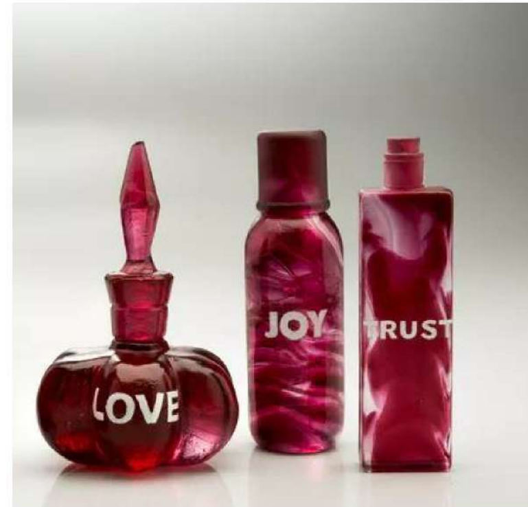
Silvia Levenson, Self Steem , 2018.

Sur toute l'année 2024, cette exposition plurielle, réinterprétation d'un thème plus que jamais d'actualité, offre au public l'opportunité d'explorer les facettes de la société de surconsommation à travers plusieurs thématiques : le rapport à l'argent, qui conditionne tous les excès ; le gaspillage alimentaire et l'obsolescence programmée, qui engendrent chaque année des tonnes de déchets mettant en péril l'équilibre écologique planétaire ; enfin, les nouvelles perceptions et les codes inédits d'une société qui définit des normes difficilement atteignables. Entre images familières, symbolisme, références culturelles et historiques et œuvres « à charge », les pièces de verre exposées viennent souligner avec justesse les excès contemporains.