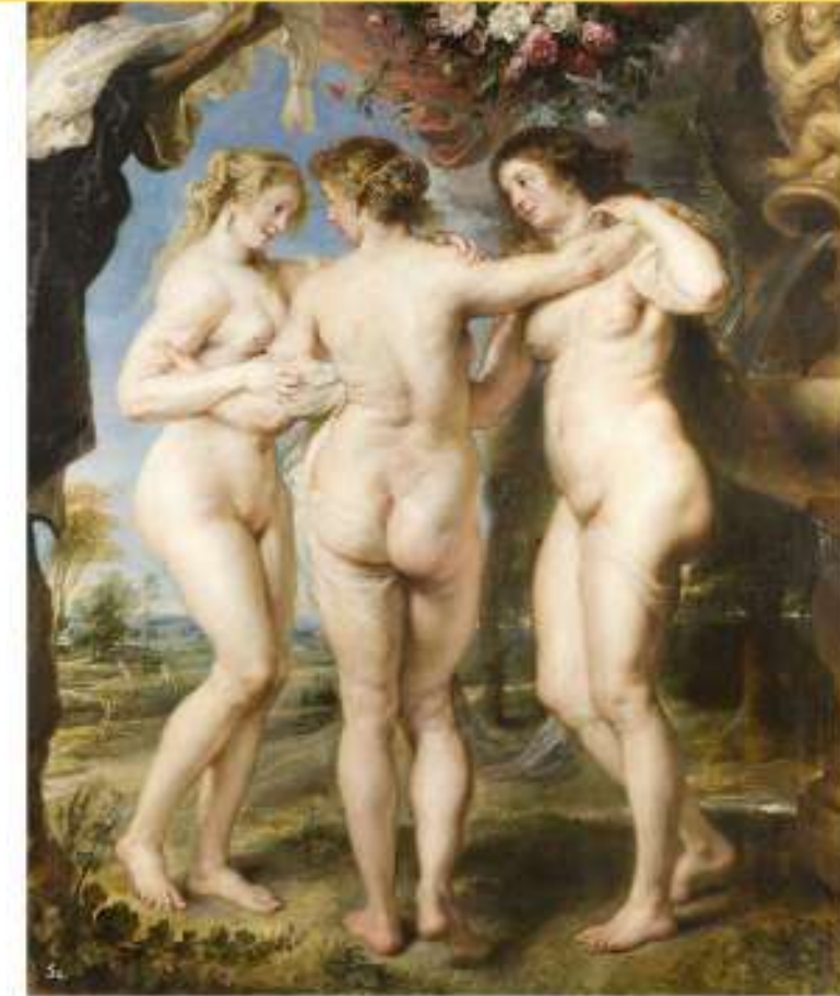
Pierre Paul RUBENS Les trois Grâces , 1639.