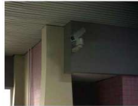
Thomas DEMAND, Camera , 2007.

Julien ASSANGE (cybermilitant, informaticien, journaliste, lanceur d'alerte)