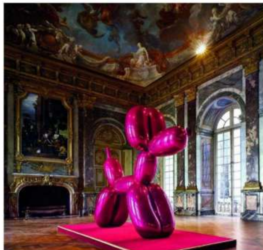
Jeff KOONS, Ballon Dog (Magenta) , 1994-2006 Œuvre présentée dans le Salon d'Hercule du château de Versailles dans le cadre de l'exposition Koons Versailles en 2008.