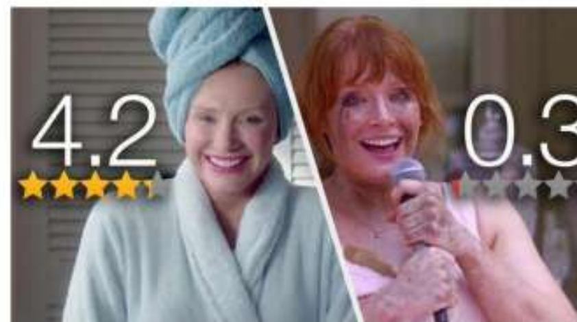
Joe WRIGHT et Charlie BROOKER, série Black Mirror , Nosedive ( Chute libre ), saison 3, épisode 1, 2016. Dans ce monde, tout est basé sur une application à mi-chemin entre Instagram et Tinder où l'on note les gens que l'on rencontre.