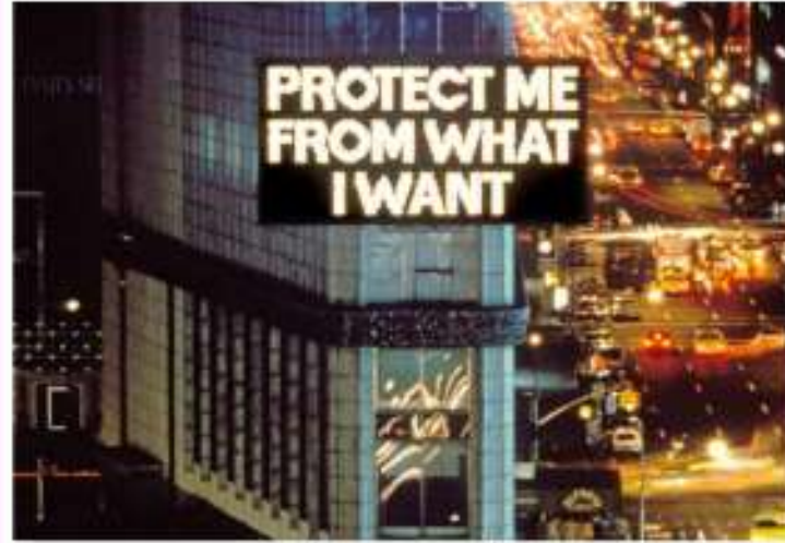
Jenny HOLZER, série Survival (1983-85), 1985.

Est-ce juste moi, ou la surveillance générale des services secrets est-elle obscure et scandaleuse ?" AI GORE