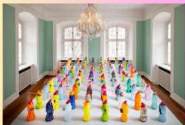
Wilhelm Vernim, « Aren't we all... », 2018.

"Nul d'entre nous n'est un surhomme et ne peut échapper entièrement au kitsch. Quelque soit le mépris qu'il nous inspire, le kitsch fait partie de la condition humaine."