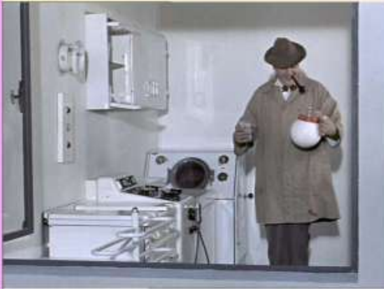
Jacques TATI, Mon oncle , 1958.

Comment la fabrication des objets et leurs traces interrogent la notion de temporalité : futur, présent, passé, anachronisme, archéologie ...?