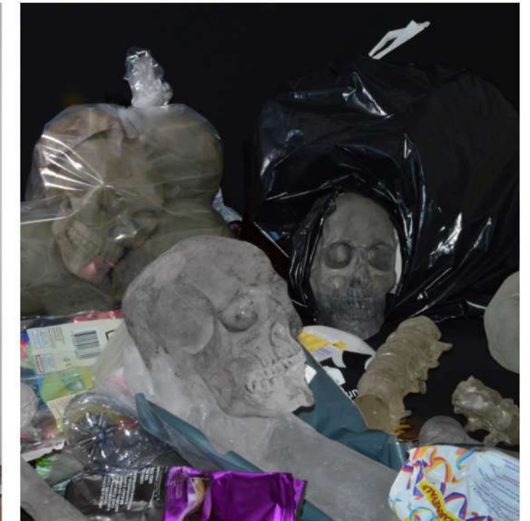
Karola Dischinger, Then will you find , 2019.