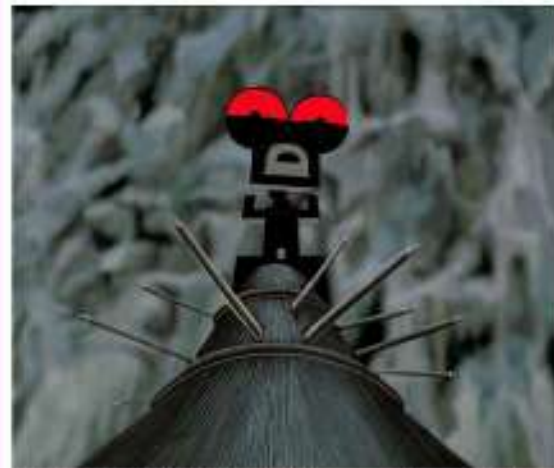
Michel OCELOT, Kirikou et la sorcière .

Allemagne de l'Est, 1983. Ayant exprimé le doute qu'un dramaturge célèbre soit loyal envers la ligne communiste, Gerd Wiesler, un officier de la Stasi, reçoit l'approbation d'espionner l'homme et sa maîtresse, l'actrice Crista-Maria. Contre toute attente, Wiesler sympathise avec le couple et vit bientôt un conflit personnel lorsque son supérieur, qui s'intéresse à l'actrice, lui ordonne de faire disparaître le dramaturge.