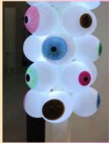
Vincent Breed, Argus Tower , 2017.