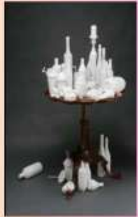
Matt Eskuche, 29 hours of television , 2008.