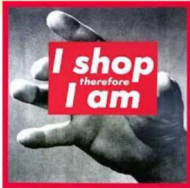
Barbara KRUGER, I shop therefore I am [ J'achète donc je suis ], 1987.

Que cela soit par le biais des réseaux sociaux ou de l'apparence physique, plaire est une question intrinsèque à la société. Au travers d'œuvres séduisantes, les artistes questionnent l'ambivalence de l'image que l'on donne à voir pour être bien vu.