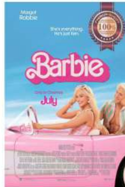
Greta GERWIG, Barbie , 2023.

"L'homme est né libre, et partout il est dans les fers" Jean-Jacques ROUSSEAU