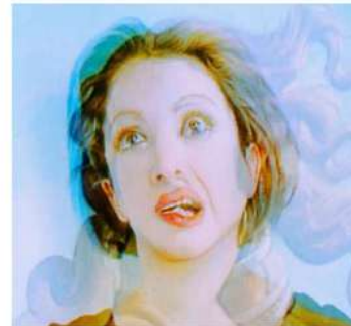
ORLAN, Entre-deux, un auto-portrait d'après Vénus , 1994.