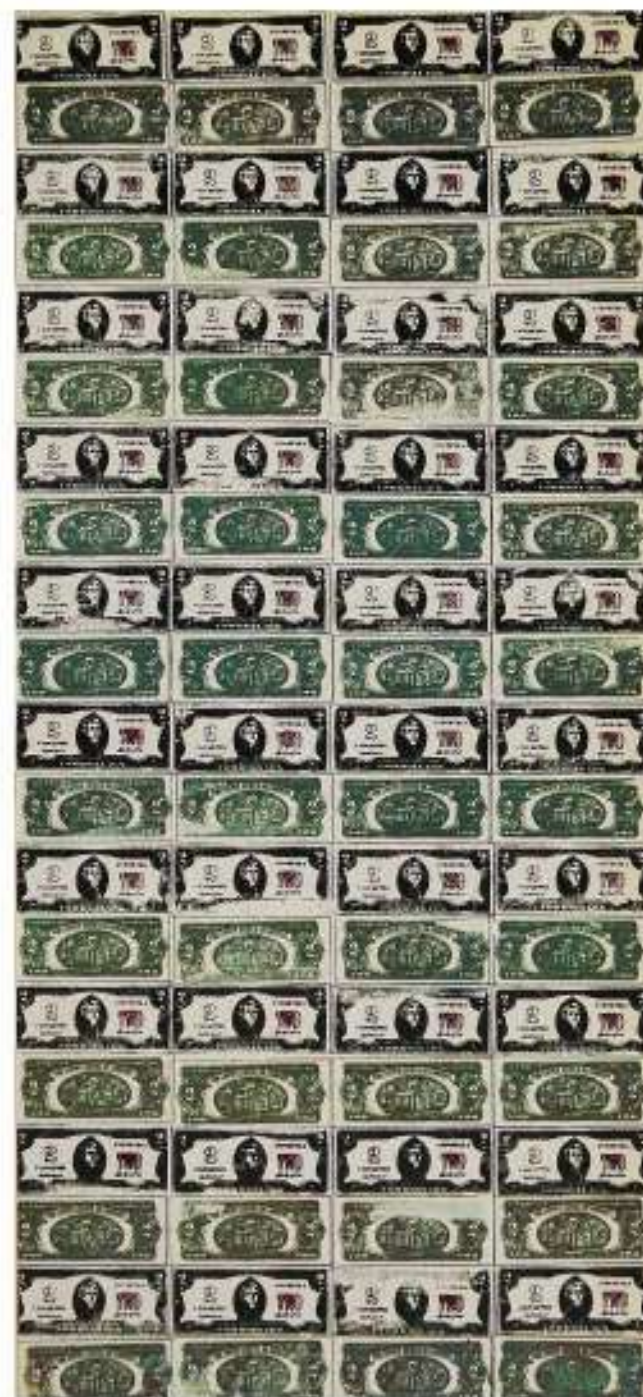
Andy WARHOL, Two Dollar Bills (front and rear) , 1962.

Quelles relations l'art entretient-il avec l'argent ?