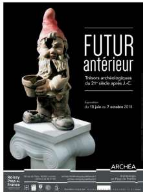
Exposition Futur antérieur . Archéa