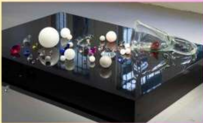
Ted Noten, If you want to be beautiful, you have to suffer , 2011.