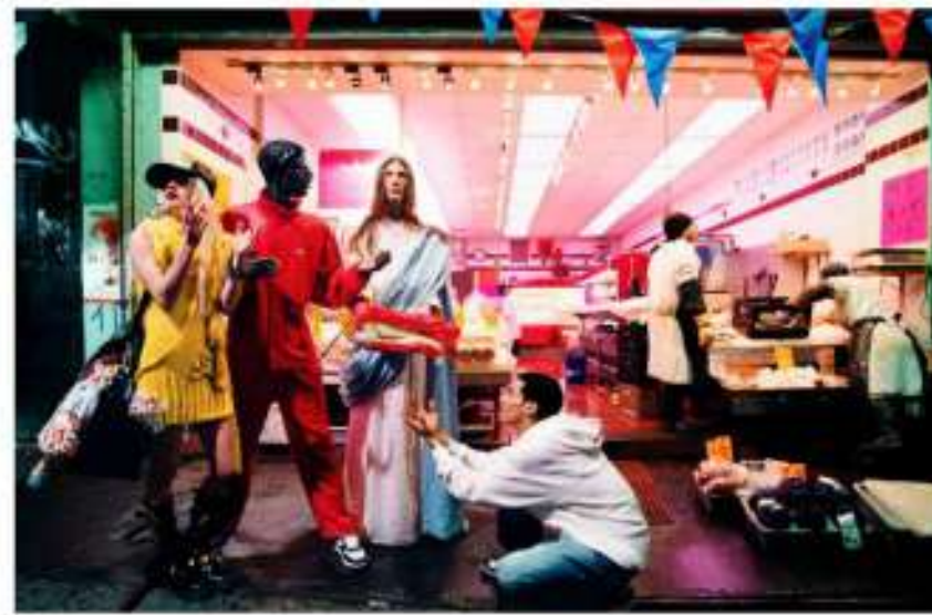
David LA CHAPELLE, Loaves and Fishes (from Jesus is my Homeboy ), 2008

"Ce qui me scandalise, ce n'est pas qu'il y ait des riches et des pauvres : c'est le gaspillage." Mère Térésa