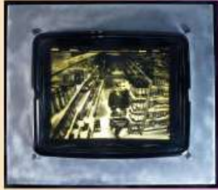
Jeff Zimmer, CCTV Series , 2005.