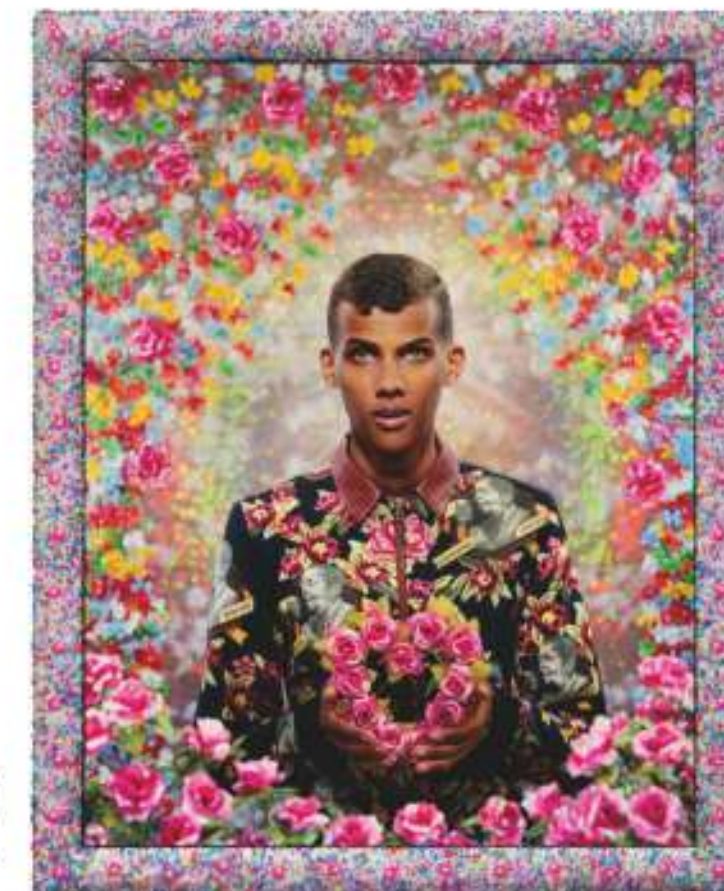
Pierre et Gilles, For Ever (Stromae) , 2014.