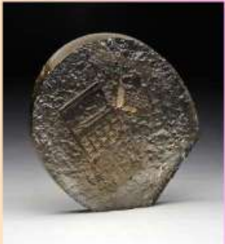
Jennifer Crescuillo, Fossilized , 2016.