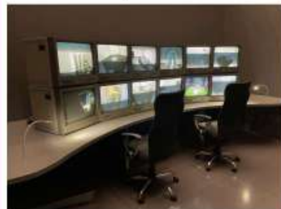
ELMGREEN & DRAGSET, installation Bonne chance au Centre Pompidou Metz, juin 2023-avril 2024.

Dans une lueur d'espoir, l'installation immersive "Bonne Chance" démontre que vivre sous le contrôle de la société n'est pas une question de chance mais plutôt une question de choix.