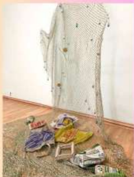
Shige Fujishiro, Unter dem Meer - Schleppnetz, 2023.

Only after the last tree has been cut down, 2020.